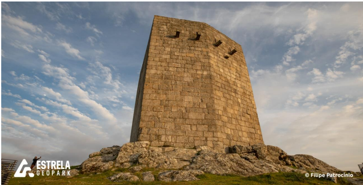
Figura 2. Vista da Torre de Menagem da Cidade da Guarda.

Localizada na cidade da Guarda, a 1056 metros de altitude (ponto de maior altitude desta cidade), surge a Torre de Menagem. Esta torre, construída entre os séculos XII e XIII, é uma evidência de parte do Castelo que em tempos existiu na cidade da Guarda, do qual ainda restam partes da muralha que envolve a sua zona histórica. A Torre de Menagem terá feito parte da Alcáçova (estrutura militar e residencial), onde residiam o alcaide-mor e a família, servindo ainda de aquartelamento para a guarnição militar.