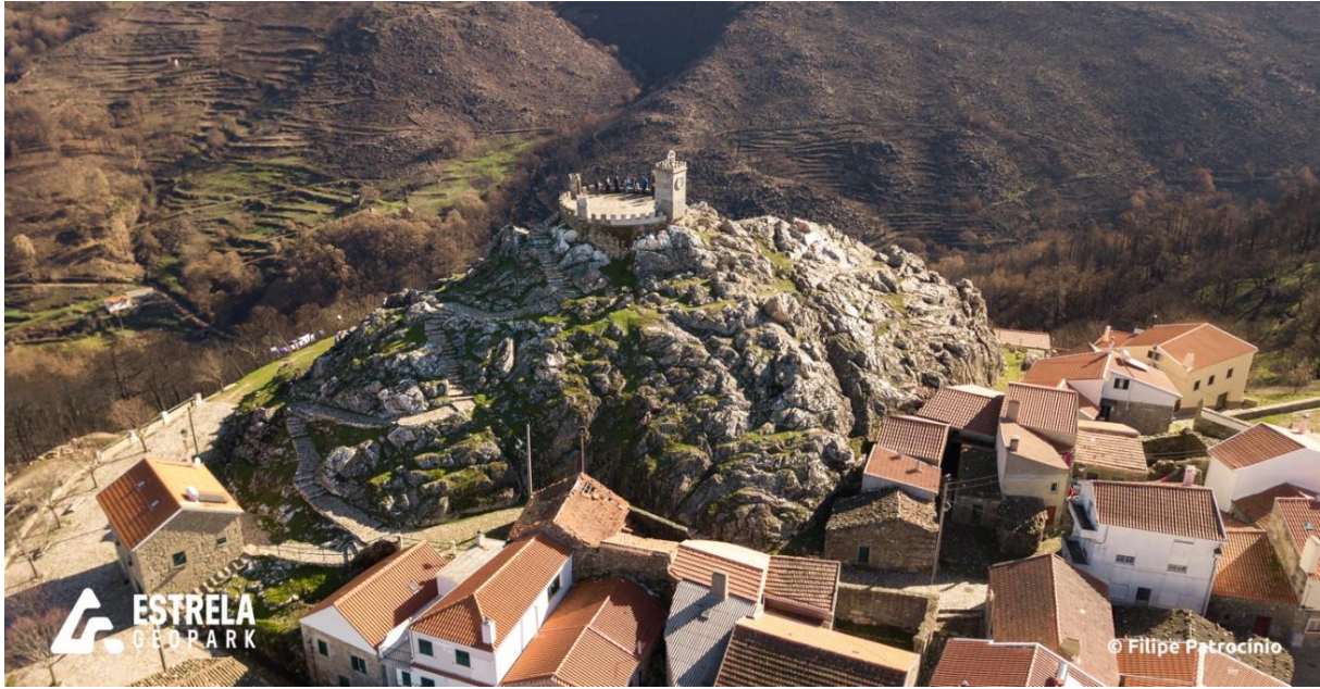
Figura 6. Castelo de Folgoso, erigido sobre o Filão de Quartzo.