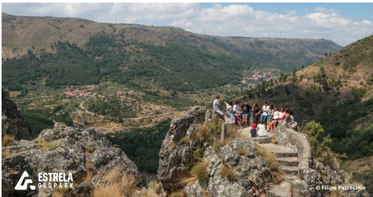
Figura 3. Vista para o Miradouro do Mocho Real e para o Vale do Mondego