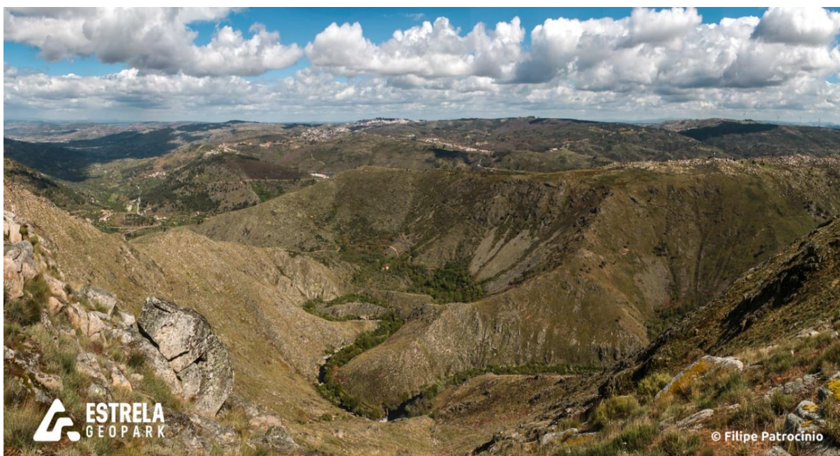
Figura 4. Meandros do Alto Mondego, vistos a partir da sua margem esquerda.

Este setor do Vale do Alto Mondego é caracterizado por um curso do rio ondulado, meandrizado e encaixado, ilustrando os processos de erosão fluvial. O traçado do Rio Mondego é fortemente influenciado pelas características geomorfológicas do terreno, sendo possível identificar diferentes tipos de rochas.