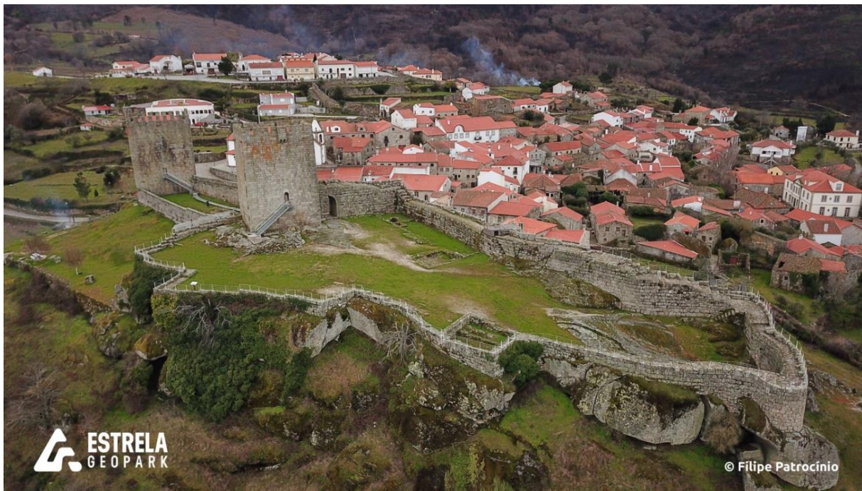
Figura 5. Vista aérea do Castelo de Linhares da Beira.

O Castelo de Linhares da Beira encontra-se instalado sobre um pequeno relevo granítico na encosta noroeste da serra da Estrela. Deste local observa-se a “Plataforma do Mondego”, uma zona aplanada que contacta com a Cordilheira Central Portuguesa, neste caso representada pela serra da Estrela, através de uma extensa zona de fratura correspondente à falha Seia-Lousã. Para lá da “Bacia do Mondego”, o relevo volta a acentuar-se, dando lugar ao limite meridional do “Planalto Central Português”.